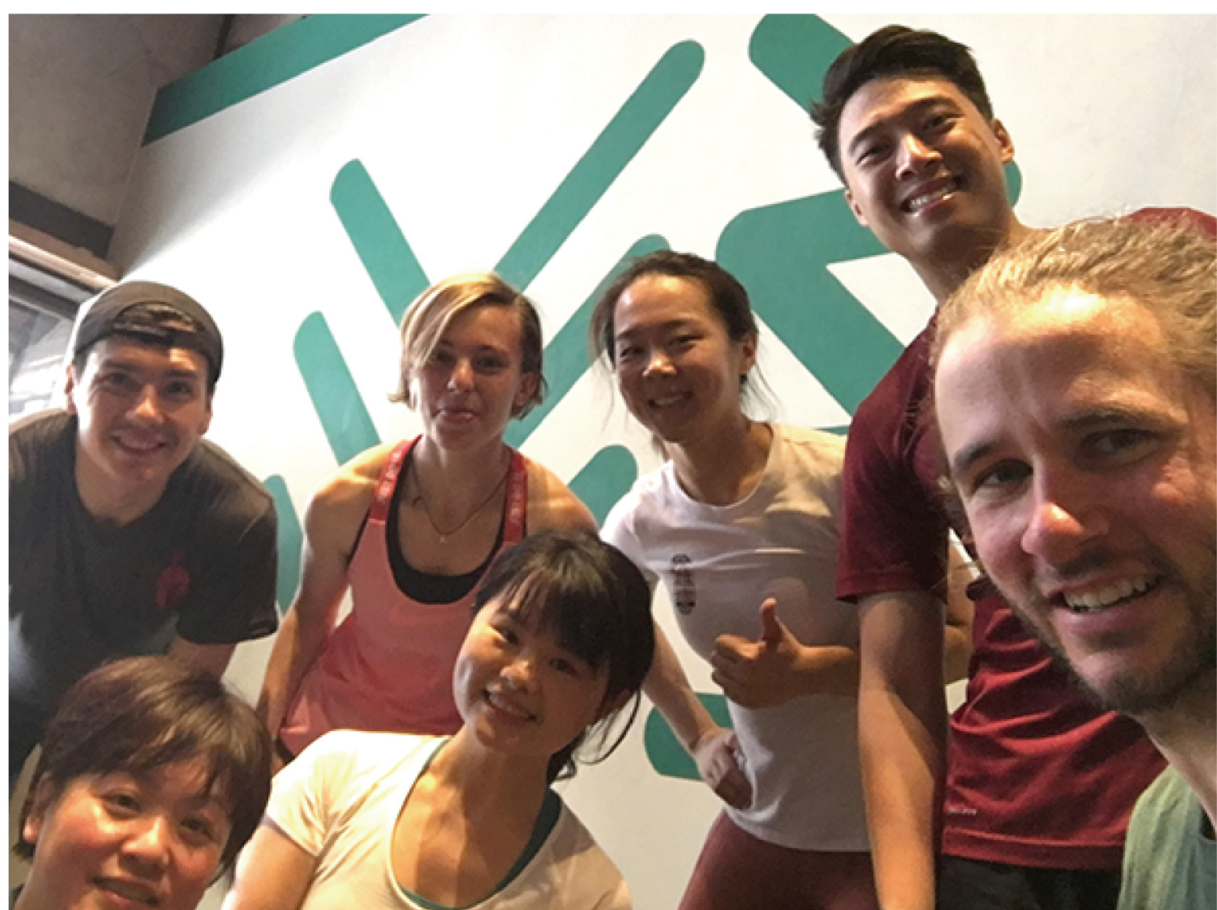
松柏メンバーと海外からのビジターたち