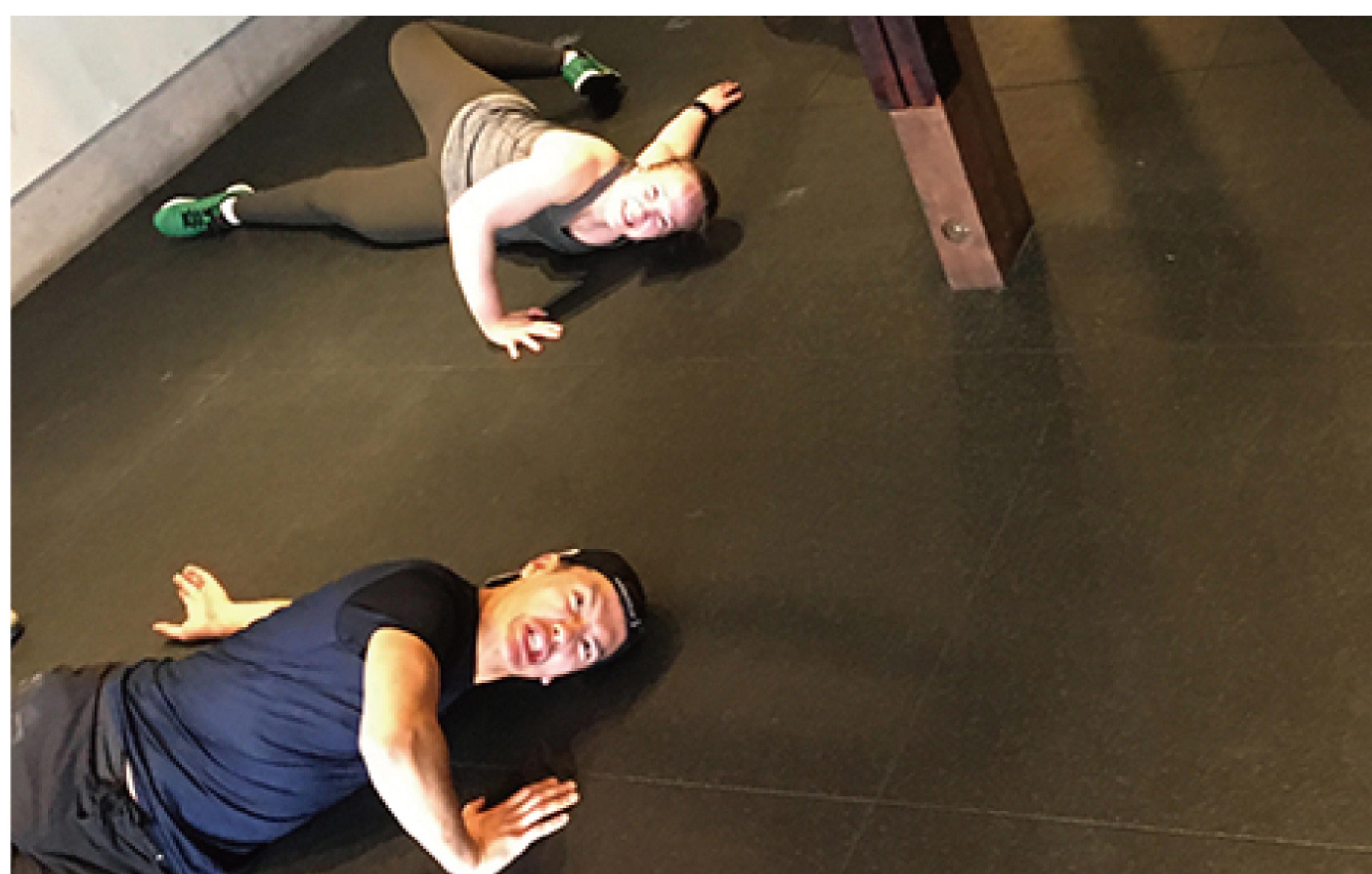
ストレッチはいやでもしっかりとやりましょうね