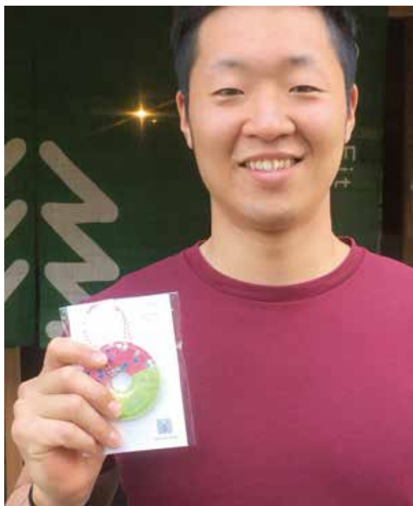
当初メンバーのKさん。アスリートになる夢を追っている